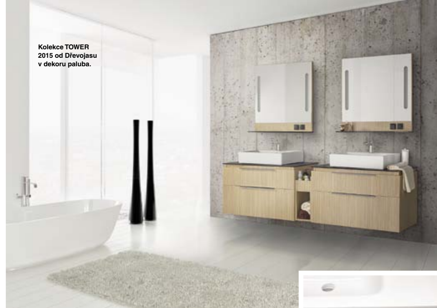
Kolekce TOWER 2015 od Dřevojasu v dekoru paluba.

Koupelnový nábytek od Dřevojasu je na trhu pojmem. „Jasně jsme se vyprofilovali jako výrobci koupelnového nábytku, kteří se nebojí přinášet nové, často i šokující trendy. V našich kolekcích se nic neopakuje, vždy jde o originální řešení. Tohoto přístupu si váží nejen čeští, ale také velmi nároční