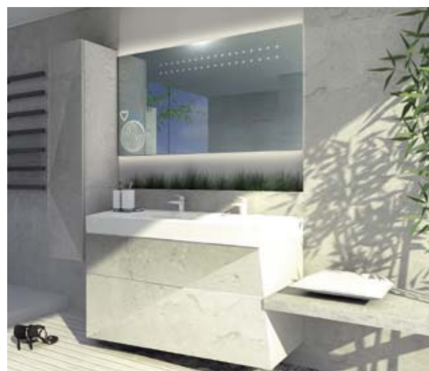
↑ Koupelna budoucnosti SANTÉ.