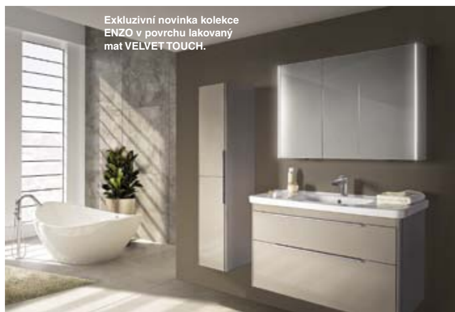
Exkluzivní novinka kolekce ENZO v povrchu lakovaný mat VELVET TOUCH.

S vitavská společnost Dřevojas, v. d., ryze český producent koupelnového nábytku, má za sebou velmi úspěšnou minulost, za kterou hovoří jeho téměř sedmdesátiletá výrobní tradice, a ještě zajímavější budoucnost. Rozhodl se totiž pro revoluční způsob v navrhování koupelnového nábytku prostřednictvím vysoce inteligentního softwarového programu imos.